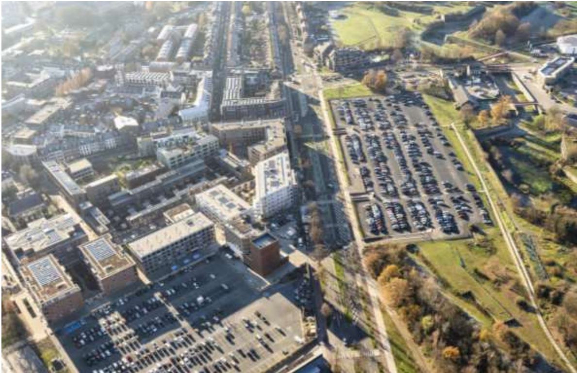
7 Parkeerplaats Frontenpark gelegen tussen de Hoge en Lage Fronten met linksonder de parkeerplaats Sphinx