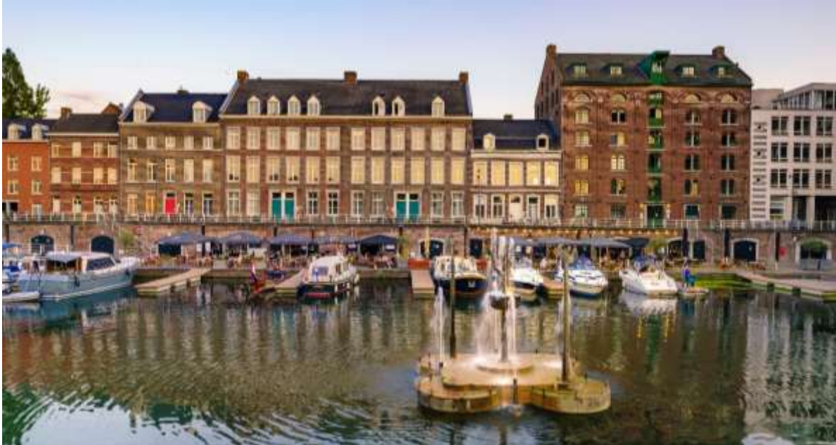
10 Bassin met Werfkelders

Reeds vorig jaar is besloten als opmaat naar het einde van de gebiedsontwikkeling in 2030, het vastgoed geleidelijk aan op één plek binnen de grex onder te brengen namelijk onder Tijdelijk Beheer. De Wijkontwikkelingsmaatschappij Belvédère is opgericht om het gebied tot herontwikkeling te brengen. Naar verwachting zal die ontwikkeling rond 2030 op grote lijnen zijn gerealiseerd. Vooralsnog is voorzien dan de grondexploitaties af te sluiten. Van de resterende vastgoedportefeuille zal dan moeten worden besloten wat er mee gaat gebeuren: verkopen aan de markt of aan de gemeente, of toch nog langer binnen de Belvédère vennootschap blijven exploiteren. De vastgoedobjecten die niet meer bijdragen aan een beoogde gebiedsontwikkeling of gemeentelijk beleidsdoel, kunnen geleidelijk worden afgestoten.