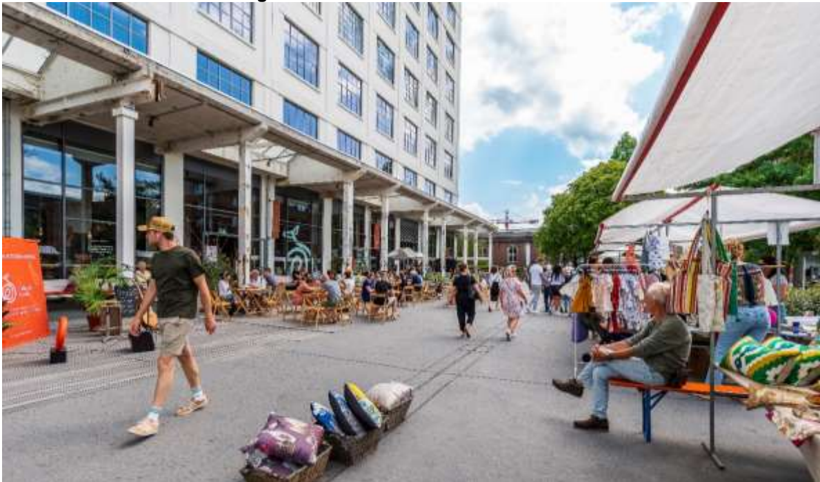
11 Sphinxmarkt 2022

Grex 4 bevat onderwerpen van algemene aard binnen de gebiedsontwikkeling Belvédère. Hieronder vallen communicatie en branding en de overhead van de gebiedsontwikkeling.