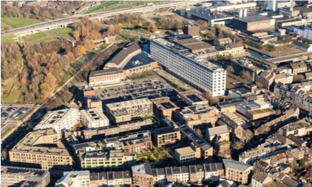
2 Locatie Sphinx-Zuid met daarachter het parkeerterrein en het Eifelgebouw