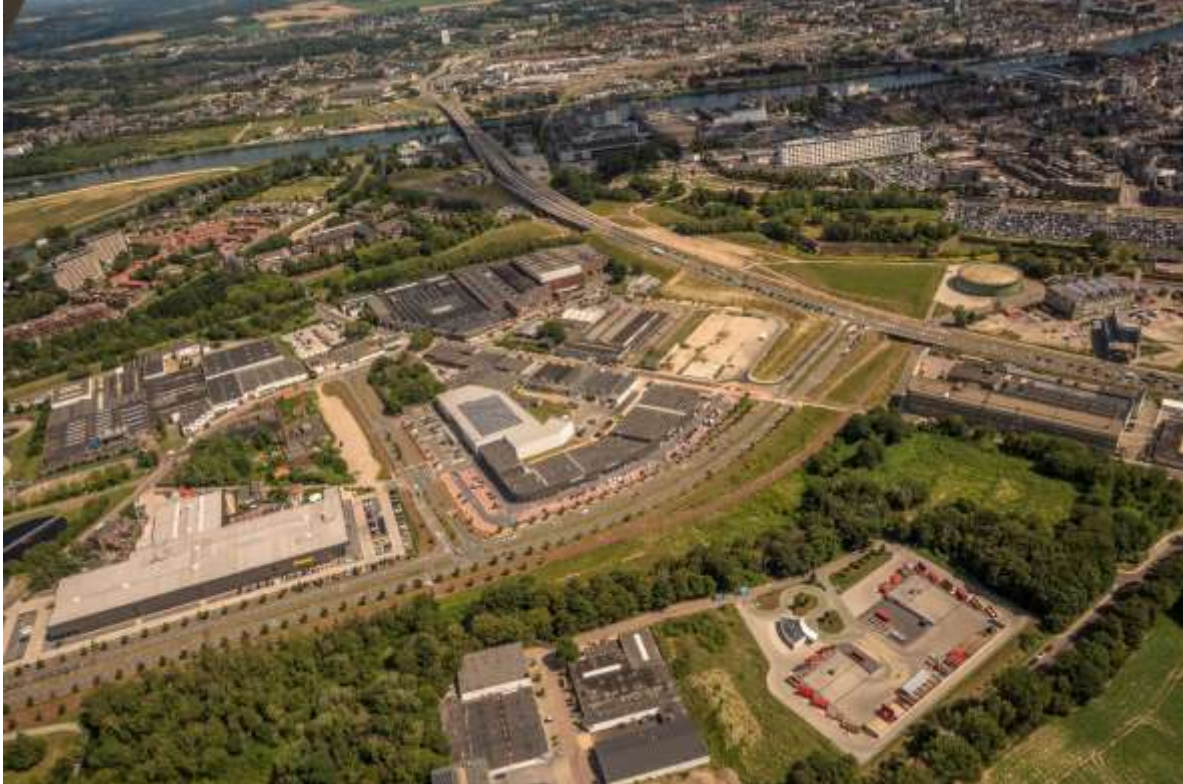
8 Bedrijventerrein Bosscherveld en Retailpark Belvédère met onderaan Het Rondeel