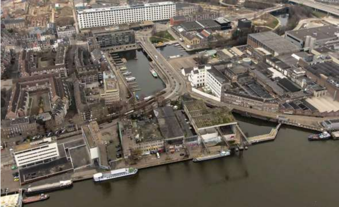
4 De locatie Landbouwbelang, gelegen tussen Maas en Bassin