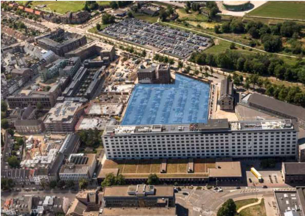
3 Locatie Sphinx Noord met de tijdelijke parkeerplaats waar herontwikkeling gepland staat