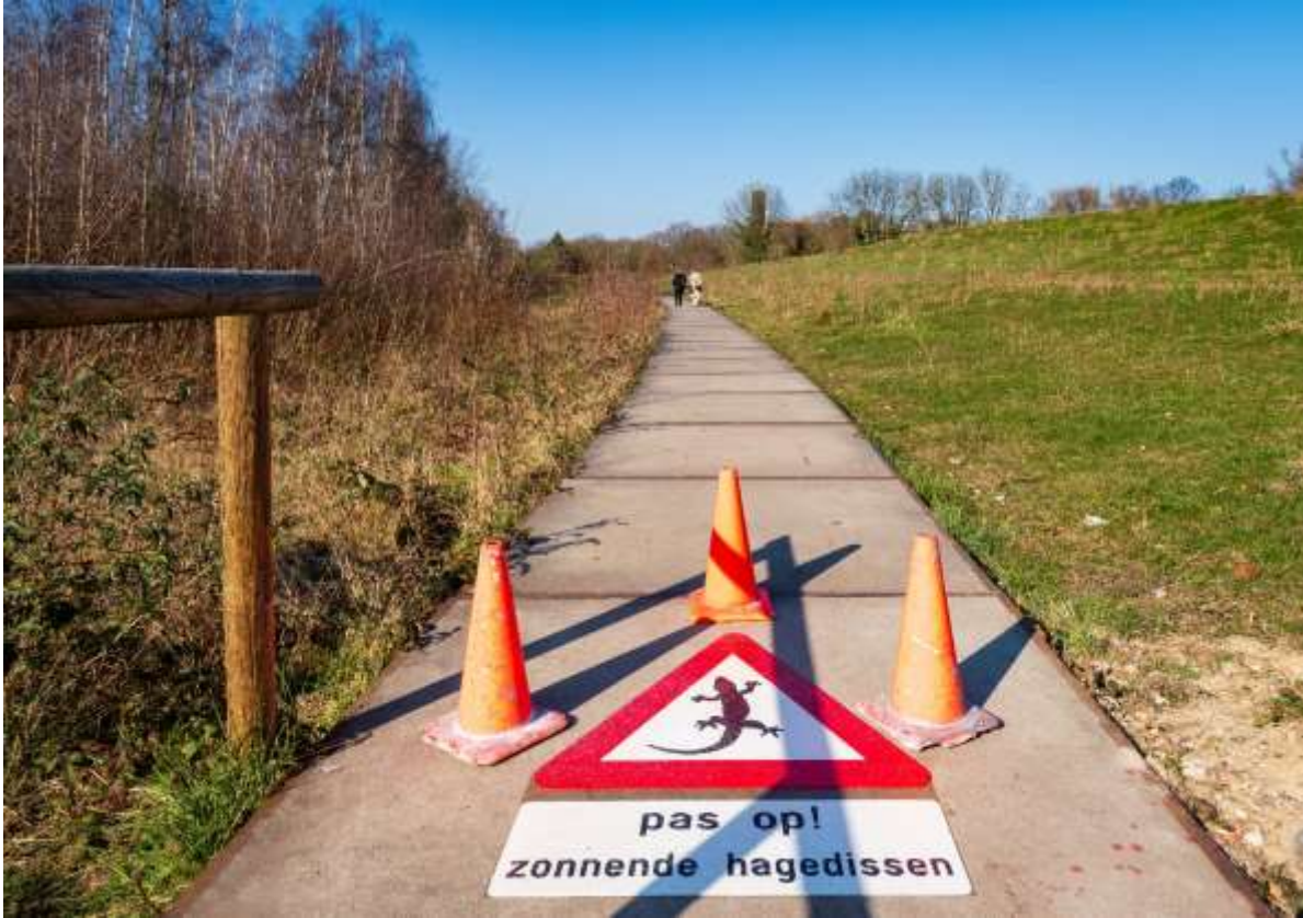
9 Hagedissenbord op het Spoorpad 2022

Op het gebied van natuurcompensatie zijn er weinig nieuwe zaken te melden. Met het oog op de nog aankomende ontwikkelingen in het Belvédèregebied is er begin 2023 een nieuwe ontheffing van de provincie ontvangen die deze ontwikkelingen op natuurgebied mogelijk maken. Verder wordt in 2023 een aantal nieuwe voorzieningen in het Frontenpark voor de muurhagedis gerealiseerd, wordt een nieuw beheerplan opgesteld en vindt natuurmonitoring plaats.