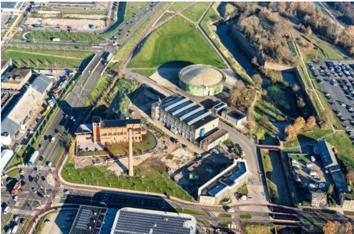
6 Gasfabriek, LAB-gebouw, Gashouder met Stadsweide, Kunstfront en Radiumplein met -schoorsteen