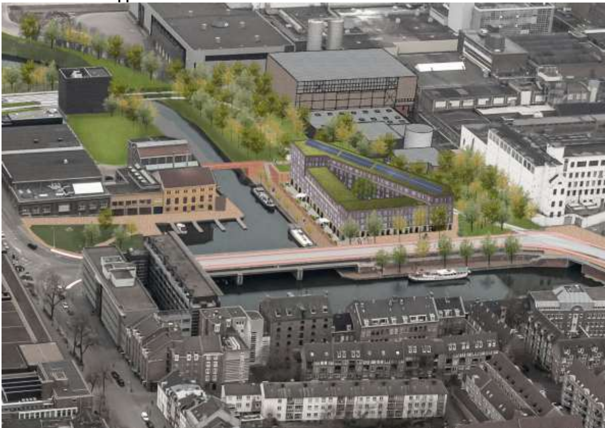
5 Artist impression van de locatie Sappi Zuidwest met doorgetrokken Maasboulevard en woningbouw